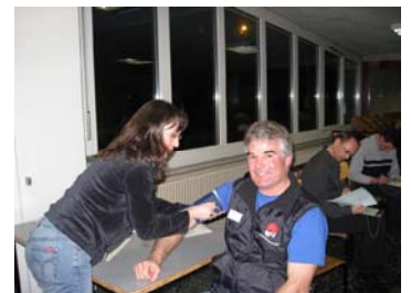
Blutdruck-Messung bei einem Spender