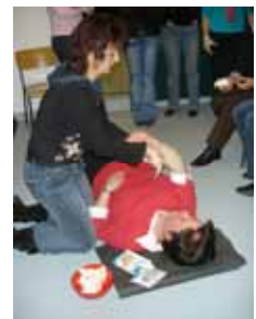
Samariter bei der Übung mit Figuranten

Samariterverein Sins www.samariter-sins.ch